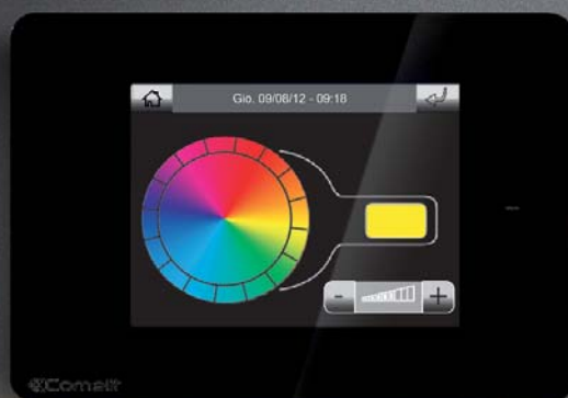
LUMIÈRE JAUNE : FONCTION CHAUFFAGE

BIEN PLUS QUE DU DESIGN : LA CRÉATIVITÉ À L'ÉTAT PUR.