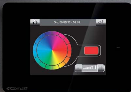
LUMIÈRE ROUGE : FONCTION ALARME