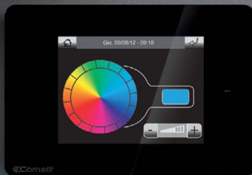
LUMIÈRE BLEUE : FONCTION REFROIDISSEMENT