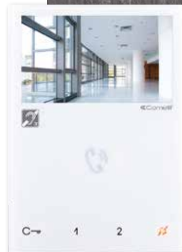
TABLEAU DES DIFFÉRENTES PLATINES DISPONIBLES

RÉGLAGE CONTRASTE, LUMINOSITÉ, VOLUME SONNERIE ET COUPEURE SONNERIE